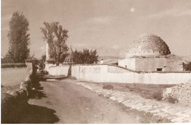
Fotoğraf 7. Turgutoğlu Pir Hüseyin Bey Türbesi/Dârü'l-Huffâzı. (geçmişten günümüze Konya fotoğraf albümü, Konya Ticaret Odası Yayını, Konya 2007)

yokken İbrahim adlı bir kişi tarafından kendisinden zorla cüzhânlık alınmış, ancak yapılan haksızlık anlaşılınca Mustafa tekrar cüzhânlık vazifesine iade edilmiştir 232 .